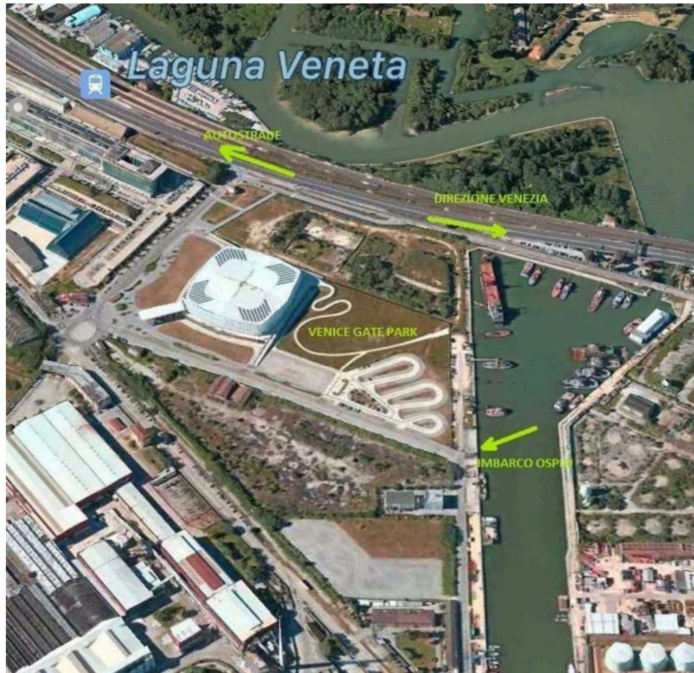
VENICE GATE PARKING - Via Galileo Ferraris